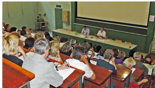
Les participants en séance plénière

En réponse aux questions s'ensuivra un plan d'actions à mettre en œuvre.